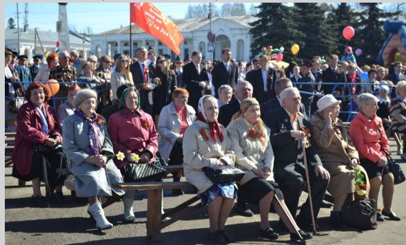
Автор: Смирнова Л. В.