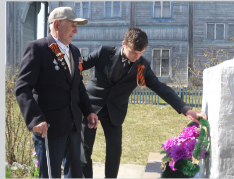
Автор: Смирнова О. Н.