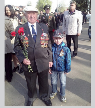
Автор: Исакова И. А.