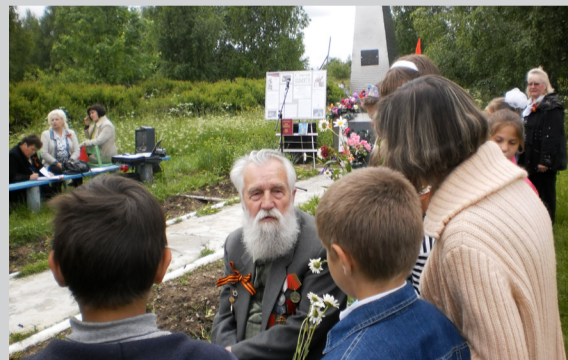
Автор: Веселов Е. В.