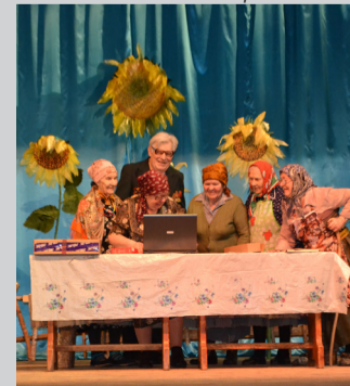
Автор: Смирнова Л. В.