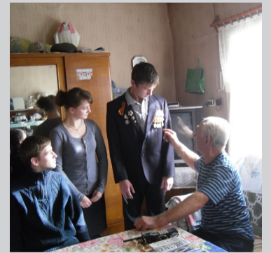
Автор: Смирнова О. Н.