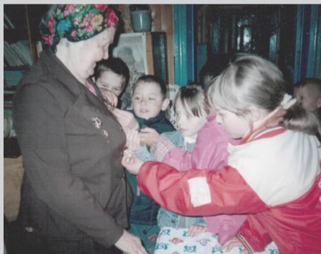
Автор: Заболотко Н. В.