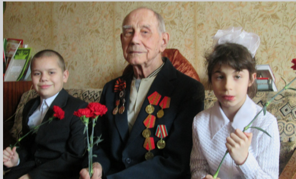
Автор: Соболева Е. К.